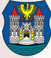
ČESKÝ TĚŠÍN Czech Republic